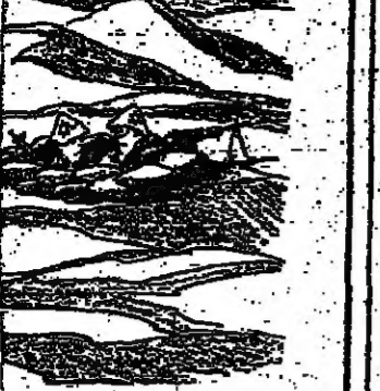
هل تشعر أننا مزلون؟ رسم من «هيرالد تريبون»